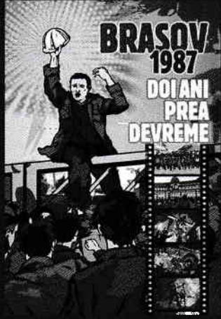
Afișul filmului documentar